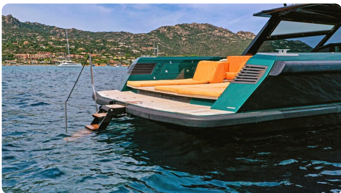
Hydraulic bathing ladder