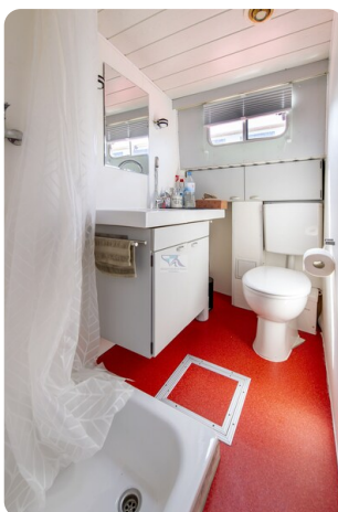
15m Stahlmotoryacht BERDA 11