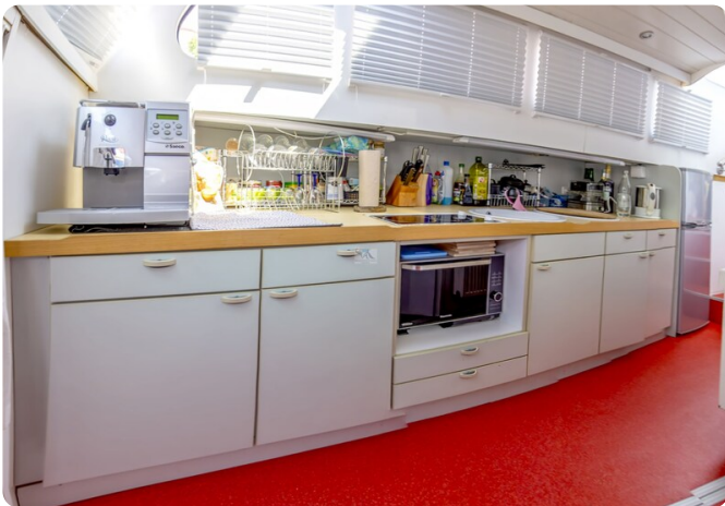
15m Stahlmotoryacht BERDA 38