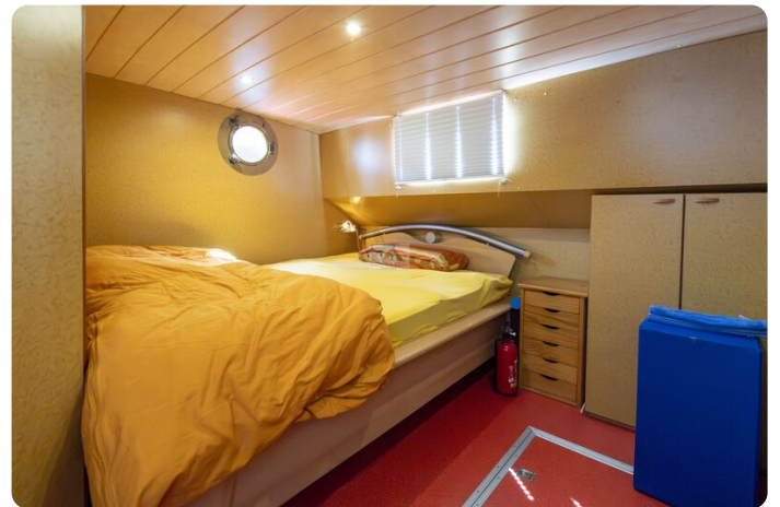
15m Stahlmotoryacht BERDA 5