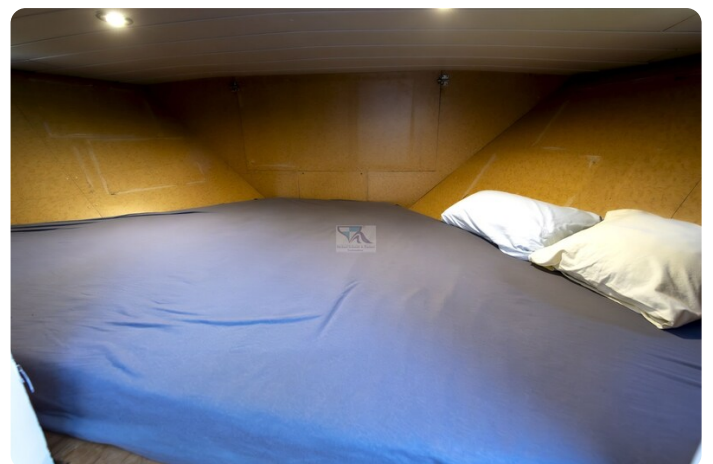
15m Stahlmotoryacht BERDA 12