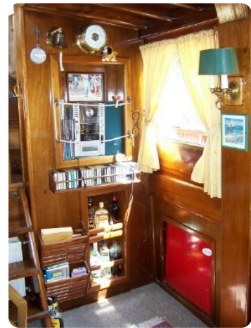
Lührsen Kutteryacht 21,50m msp256650 22