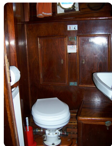
Lührsen Kutteryacht 21,50m msp256650 24