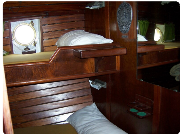
Lührsen Kutteryacht 21,50m msp256650 16