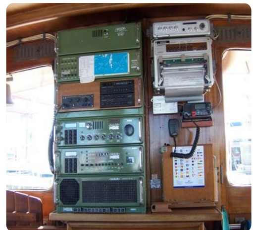
Lühsen Kutteryacht 21,50m msp256650 5