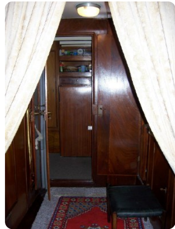
Lührsen Kutteryacht 21,50m msp256650 14