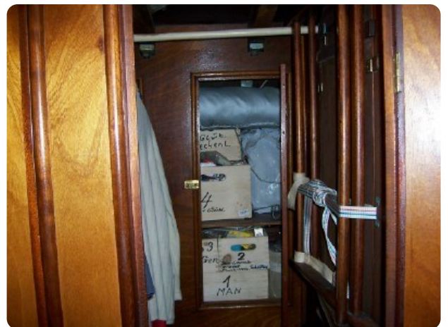
Lührsen Kutteryacht 21,50m msp256650 18