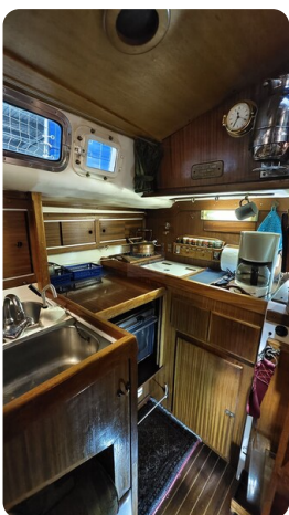
Westerly 36 Conway ANTIALOCHE 12