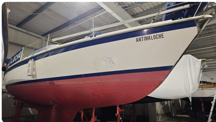
Westerly 36 Conway ANTIMALOCHE 78