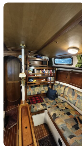
Westerly 36 Conway ANTIALOCHE 14