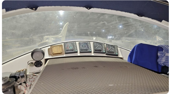
Westerly 36 Conway ANTIALOCHE 69