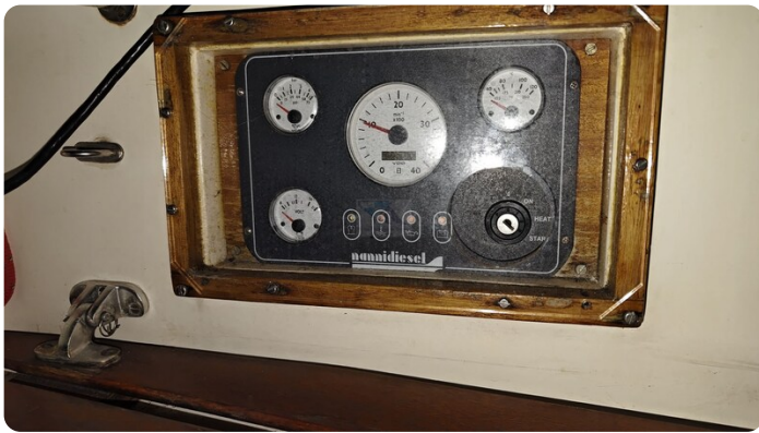
Westerly 36 Conway ANTIALOCHE 67