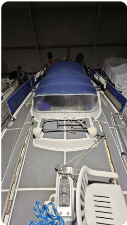
Westerly 36 Conway ANTIALOCHE 50