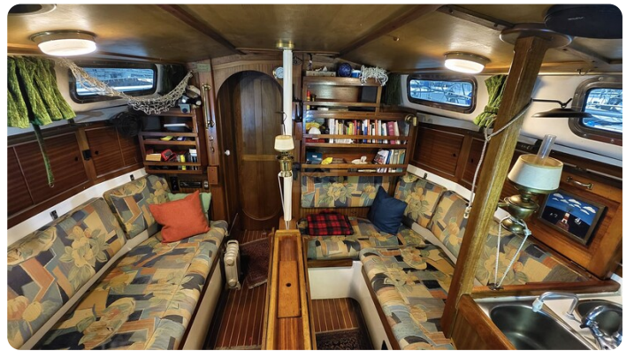
Westerly 36 Conway ANTIALOCHE 10