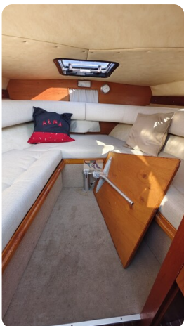
Windy 25 MIRAGE msp790159 34