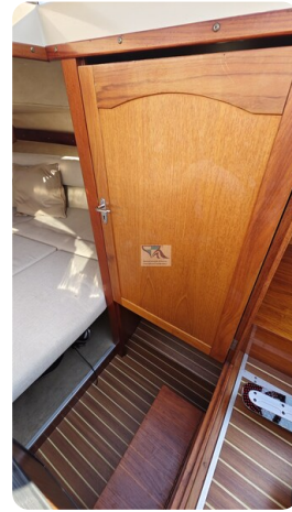
Windy 25 MIRAGE msp790159 26