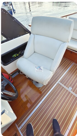
Windy 25 MIRAGE msp790159 50