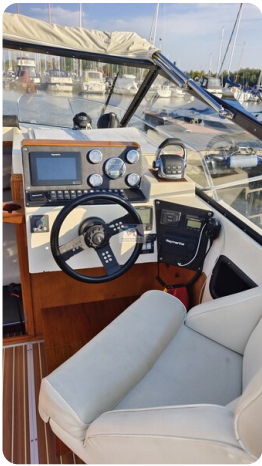
Windy 25 MIRAGE msp790159 35