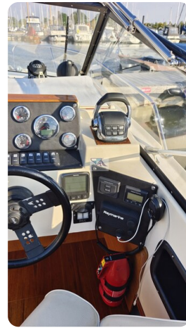
Windy 25 MIRAGE msp790159 37