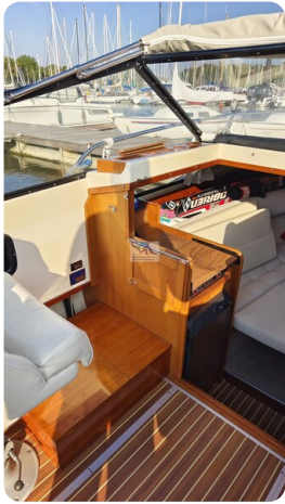
Windy 25 MIRAGE msp790159 38