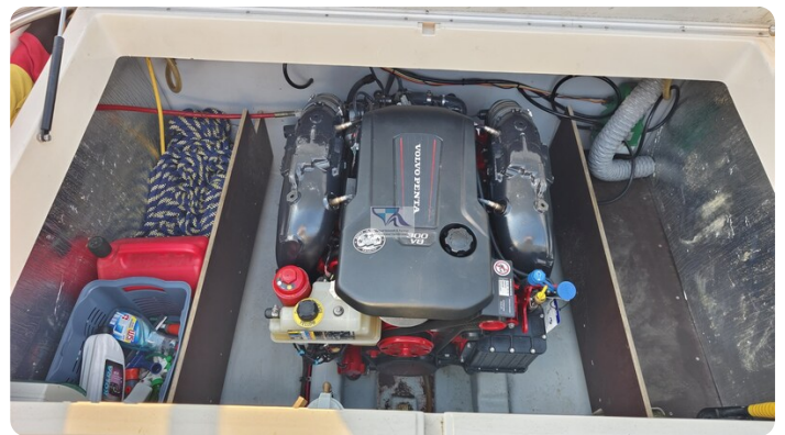
Windy 25 MIRAGE msp790159 51