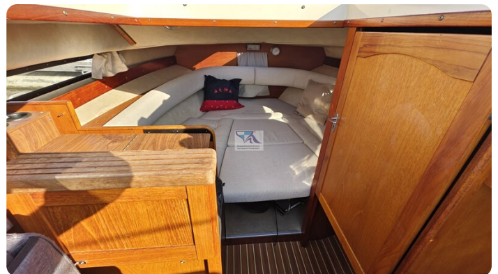
Windy 25 MIRAGE msp790159 21